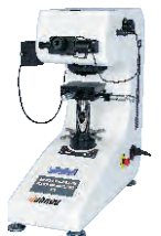
HVS-1000 (Z) 小屏幕Small screen