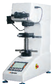
CHVS-2000Z 传感器闭环加载试验力