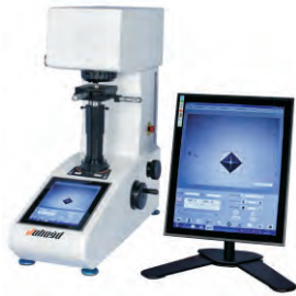
PCHVT-5Z PCHVT-10Z PCHVT-30Z PCHVT-50Z