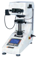
HVS-1000 (Z) 大屏幕Large Screen